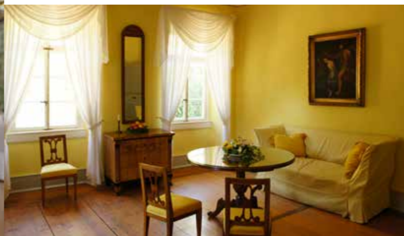
Trauzimmer im Fremdenbau