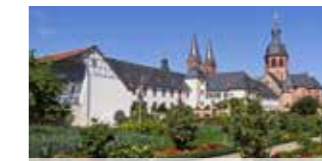
Seligenstadt Ehemalige Benediktinerabtei