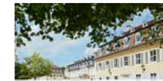
Hanau Staatspark Wilhelmsbad