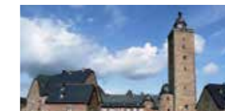
Steinau an der Straße Schloss