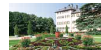
Bad Homburg Schloss und Park